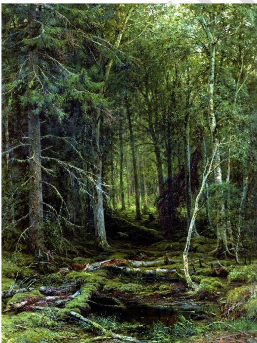
В лесной глуши.

И, напротив, полна приволья, солнца, света, воздуха его известная картина “Рожь” (1878). Картина эпична: в ней сочетаются черты национального характера русской природы, все родное, значительное.