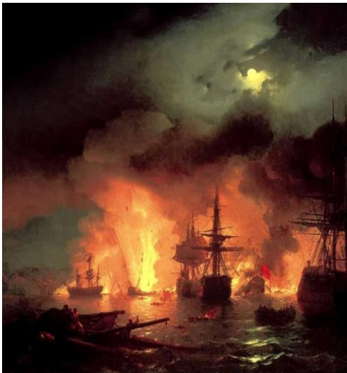
Чесменский бой 25-26 июня 1770 г.